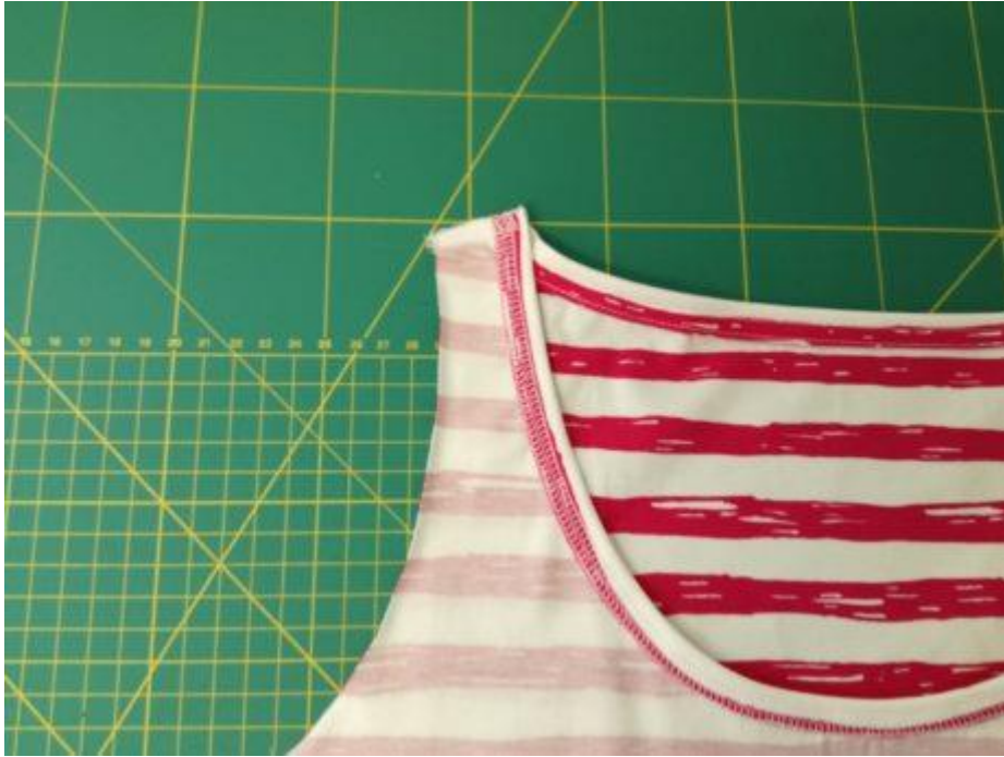
13. Náramenici sešijeme