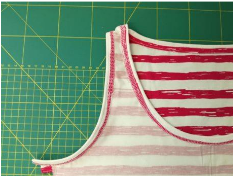
14. Olemujeme levý průrámek