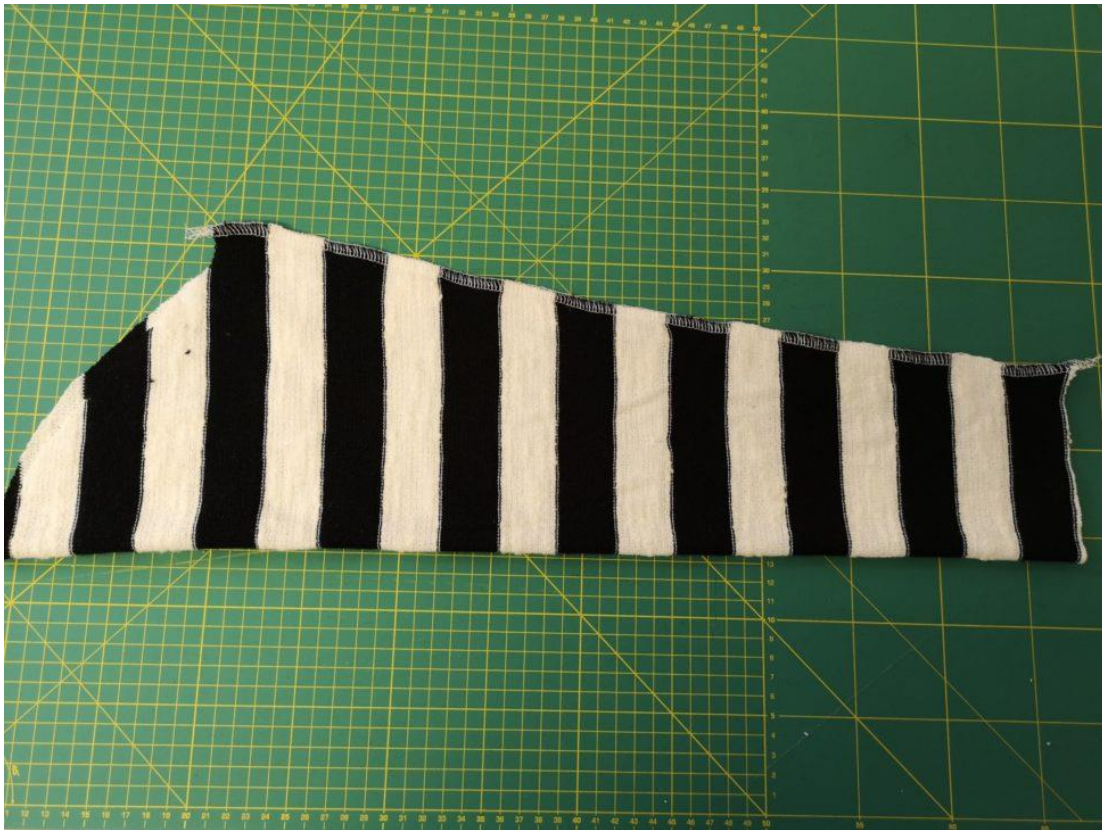
11. Rukávy sešijeme