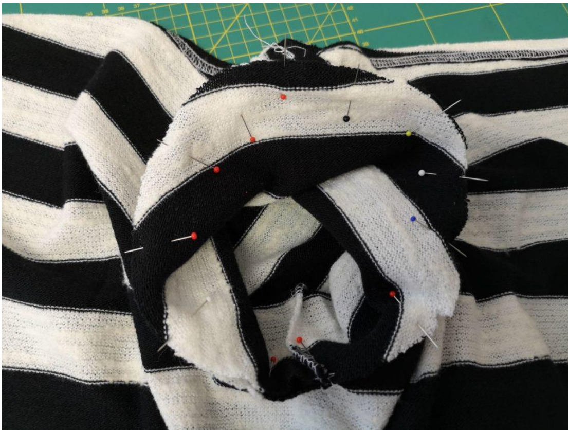
14. Rukávy dle značek vešpendlíme do kabátku