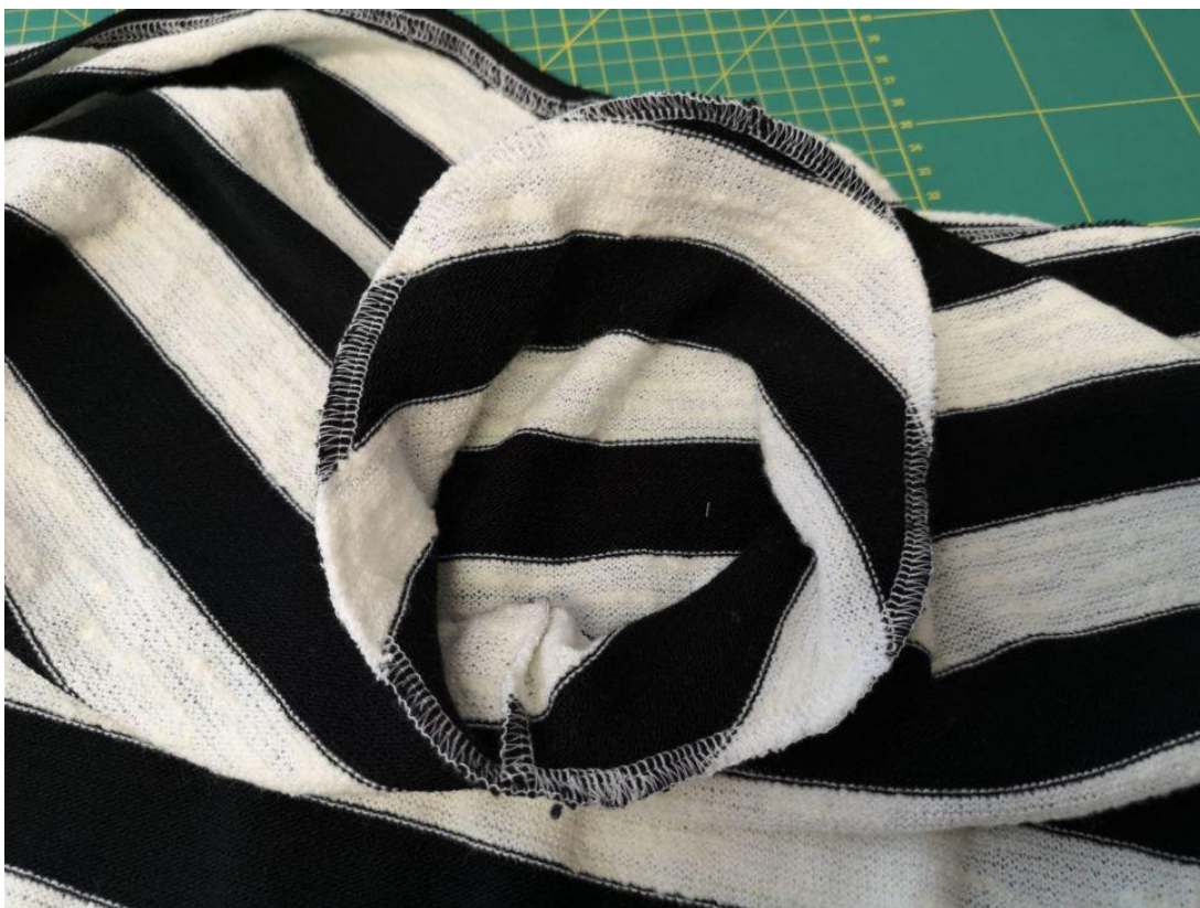
15. A našijeme