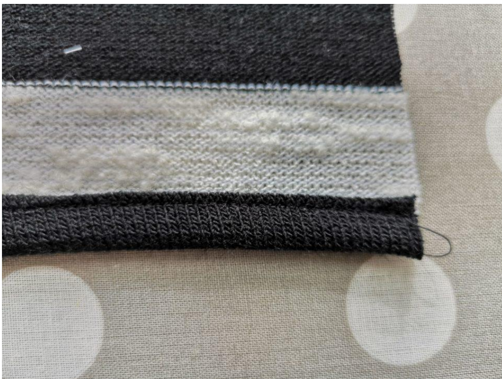
3. Ukázka založení