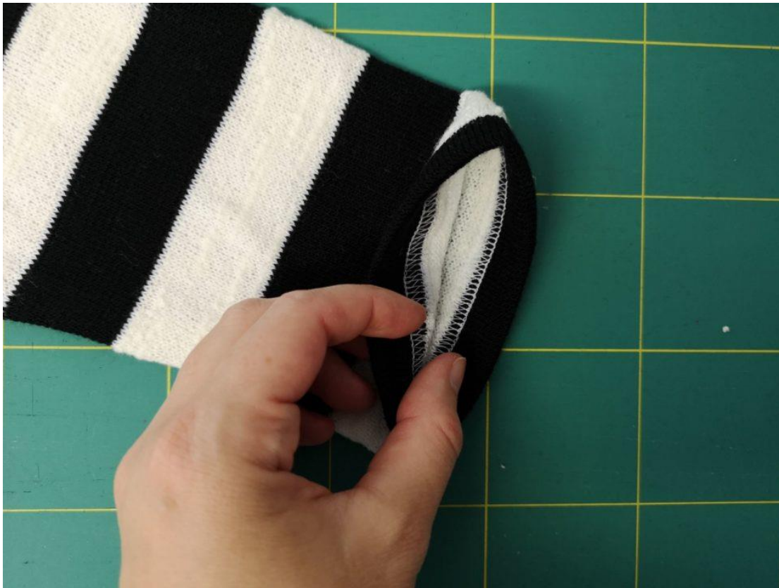
13. Opět na coverlocku a nebo dvojitým zahnutím