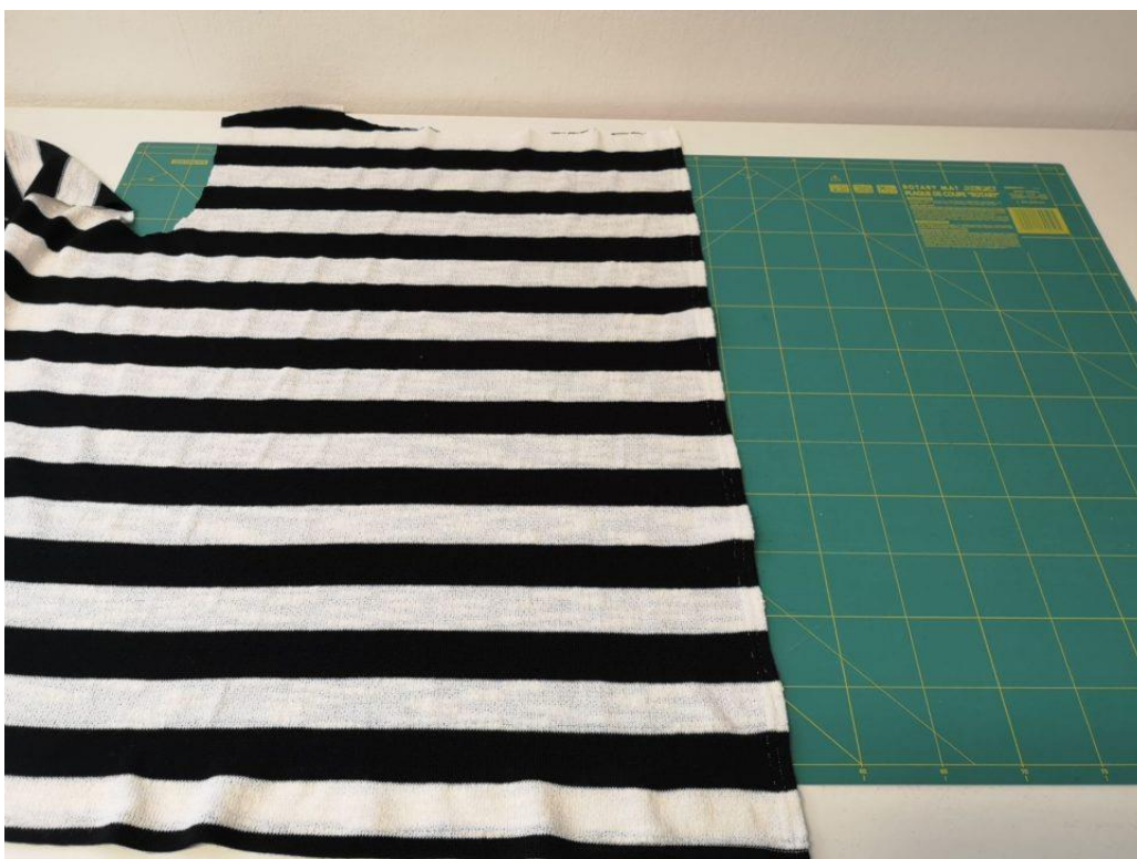
4. Poté stejným způsobem začistíme přední kraje kabátku