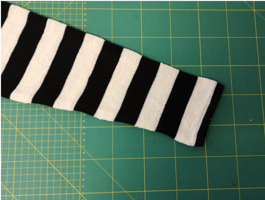
12. Zahneme dolní kraj rukávu a prošijeme