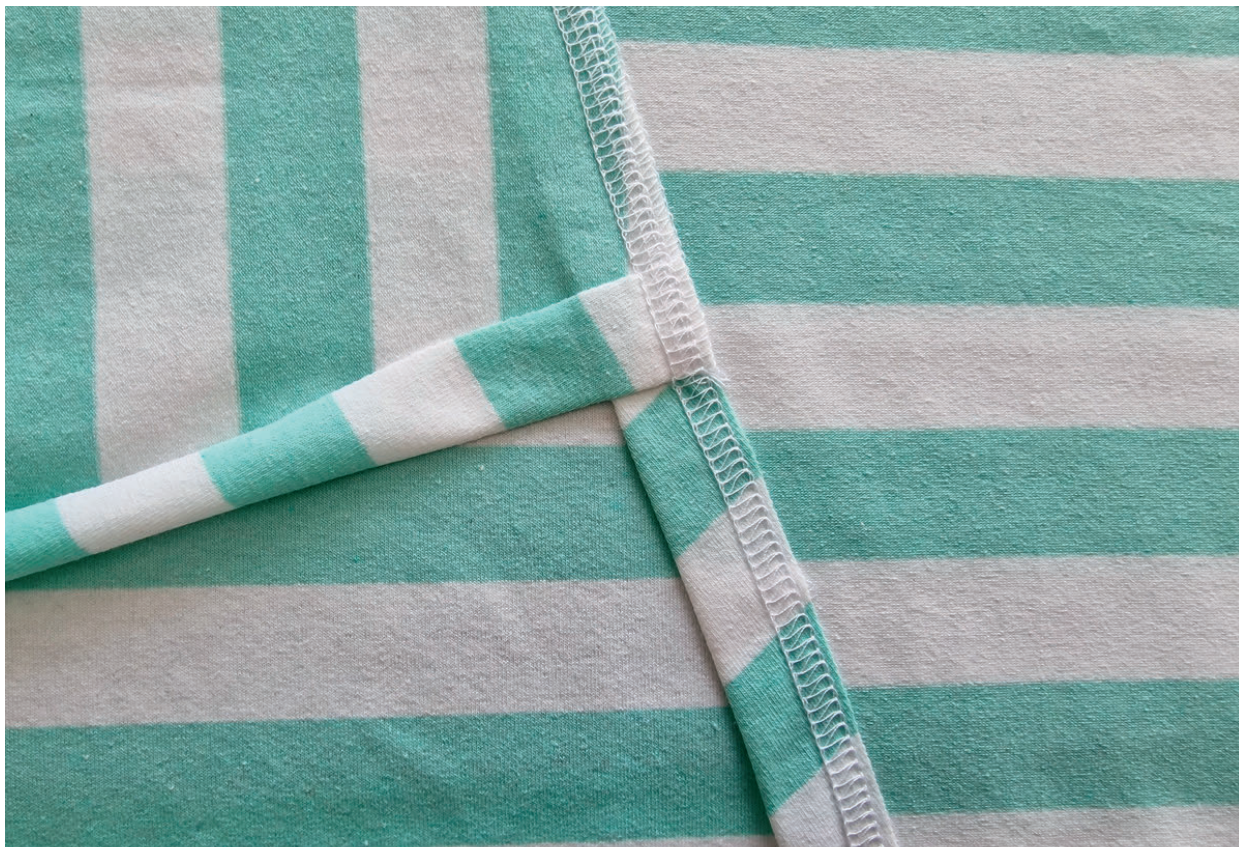
13. Detail z RS