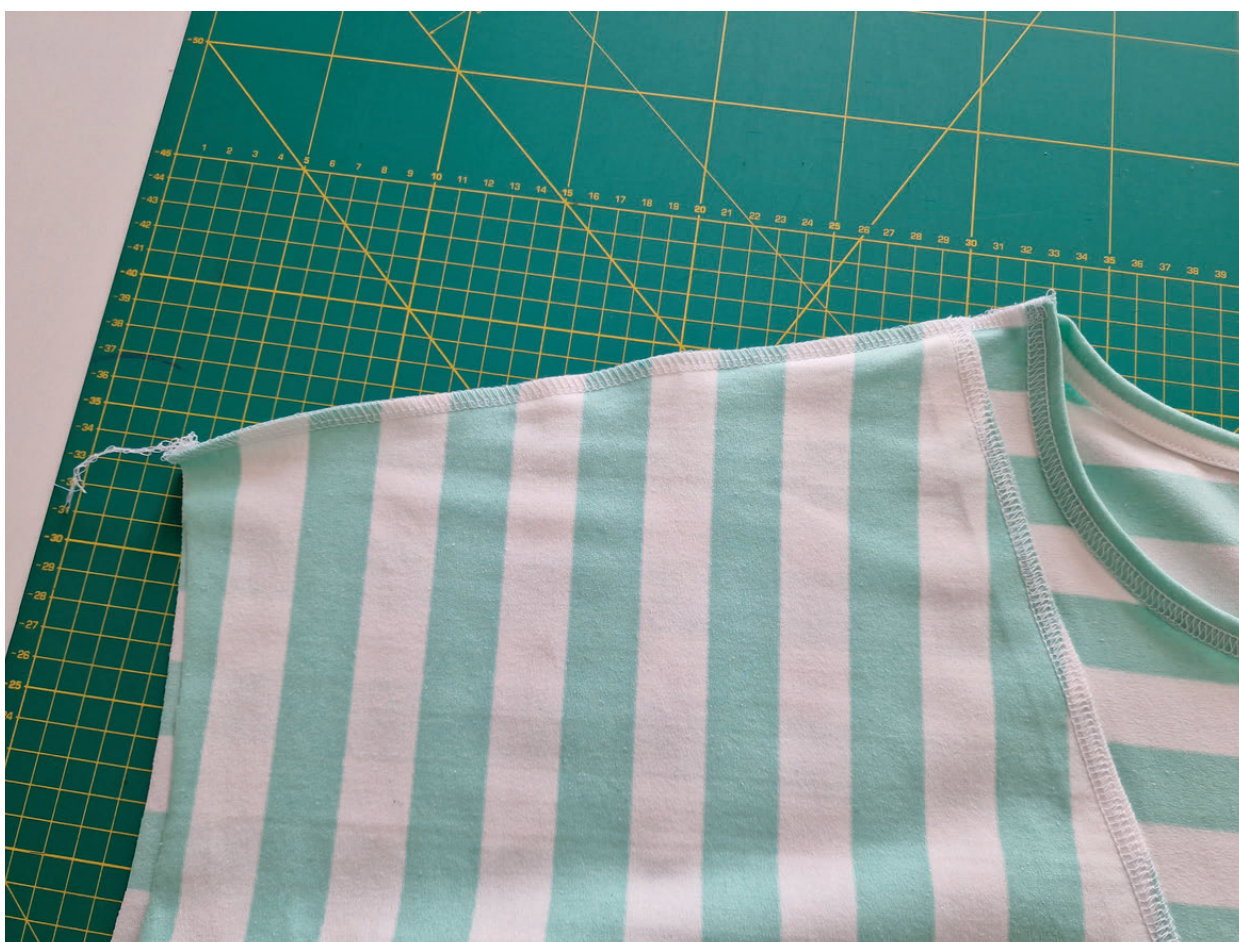
18. A sešijeme jí.