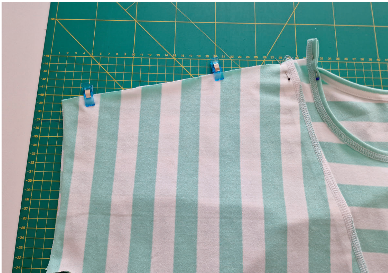
17. Sešpendíme si levou náramenici