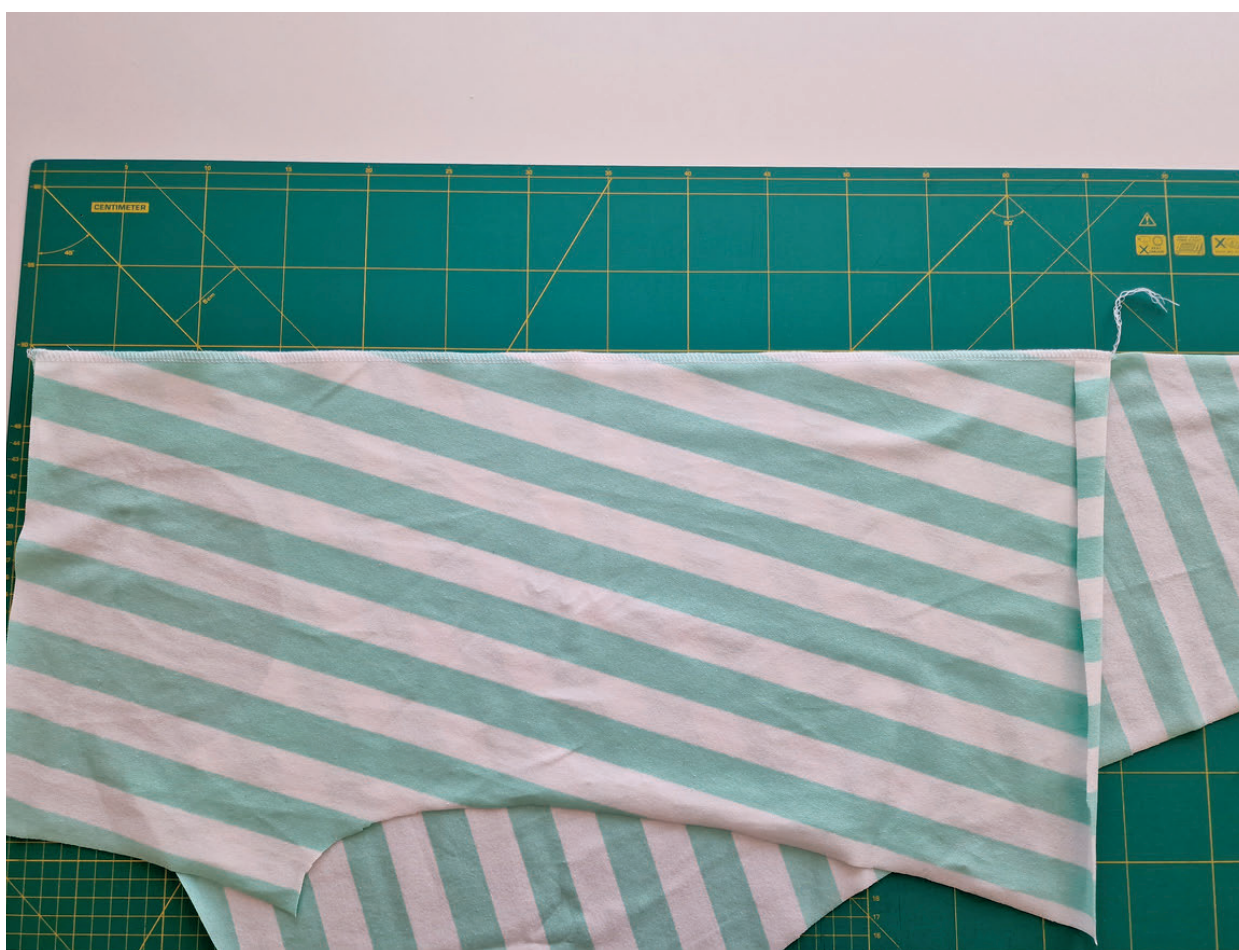
8. Sešijeme overlockem. Šijeme od náramenice až k zahnutému dolnímu kraji levého předního dílu.