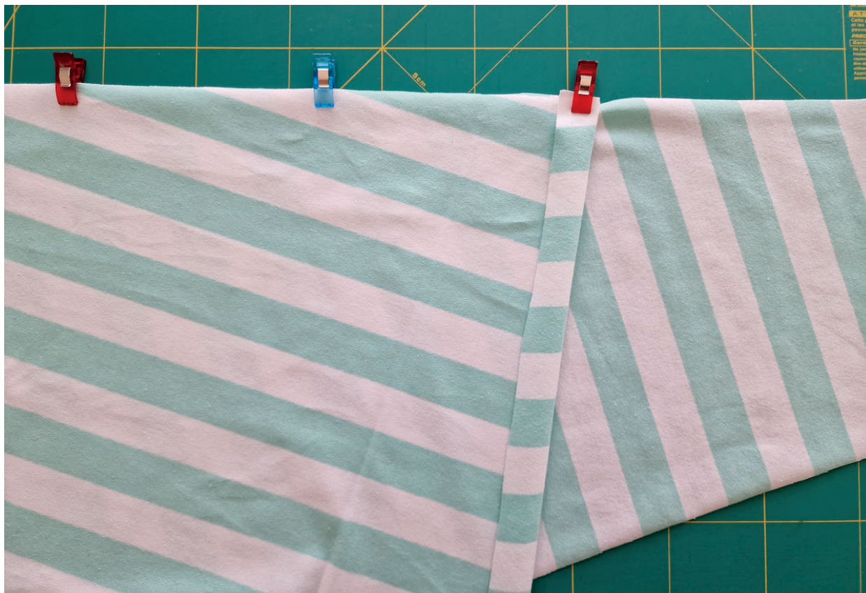
7. Detail špendlení