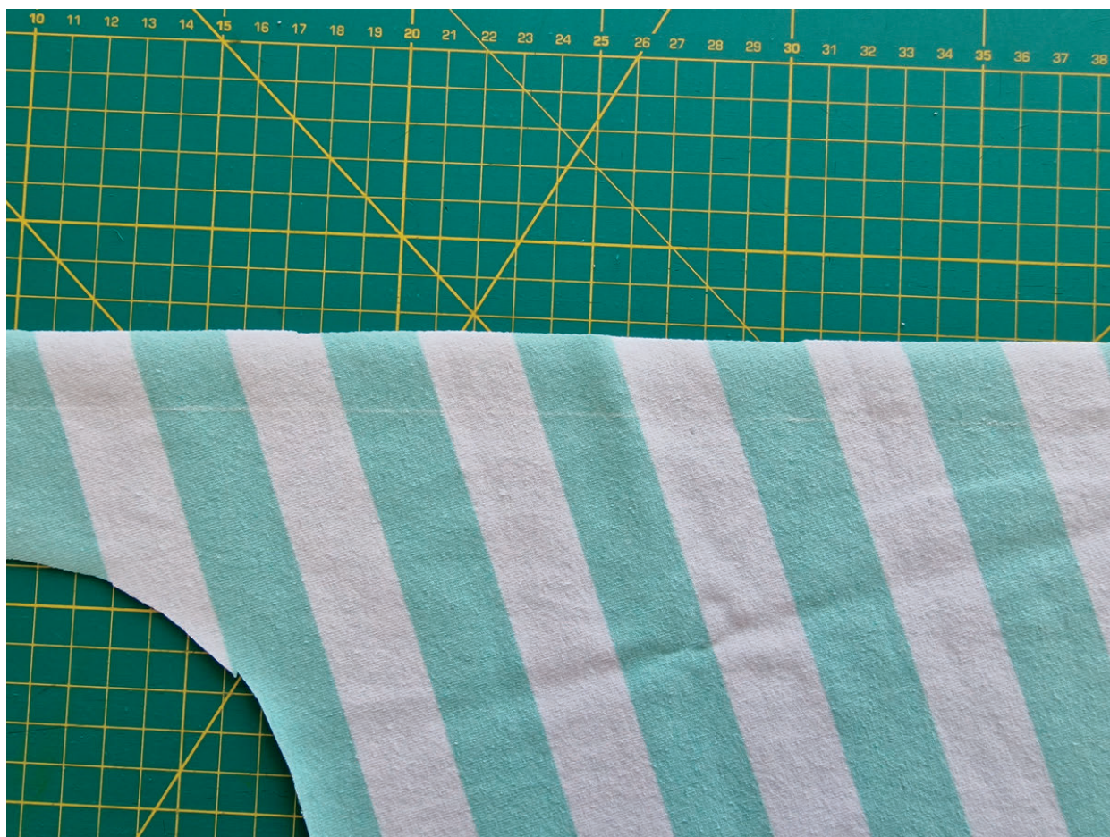
5. Detail naznačení