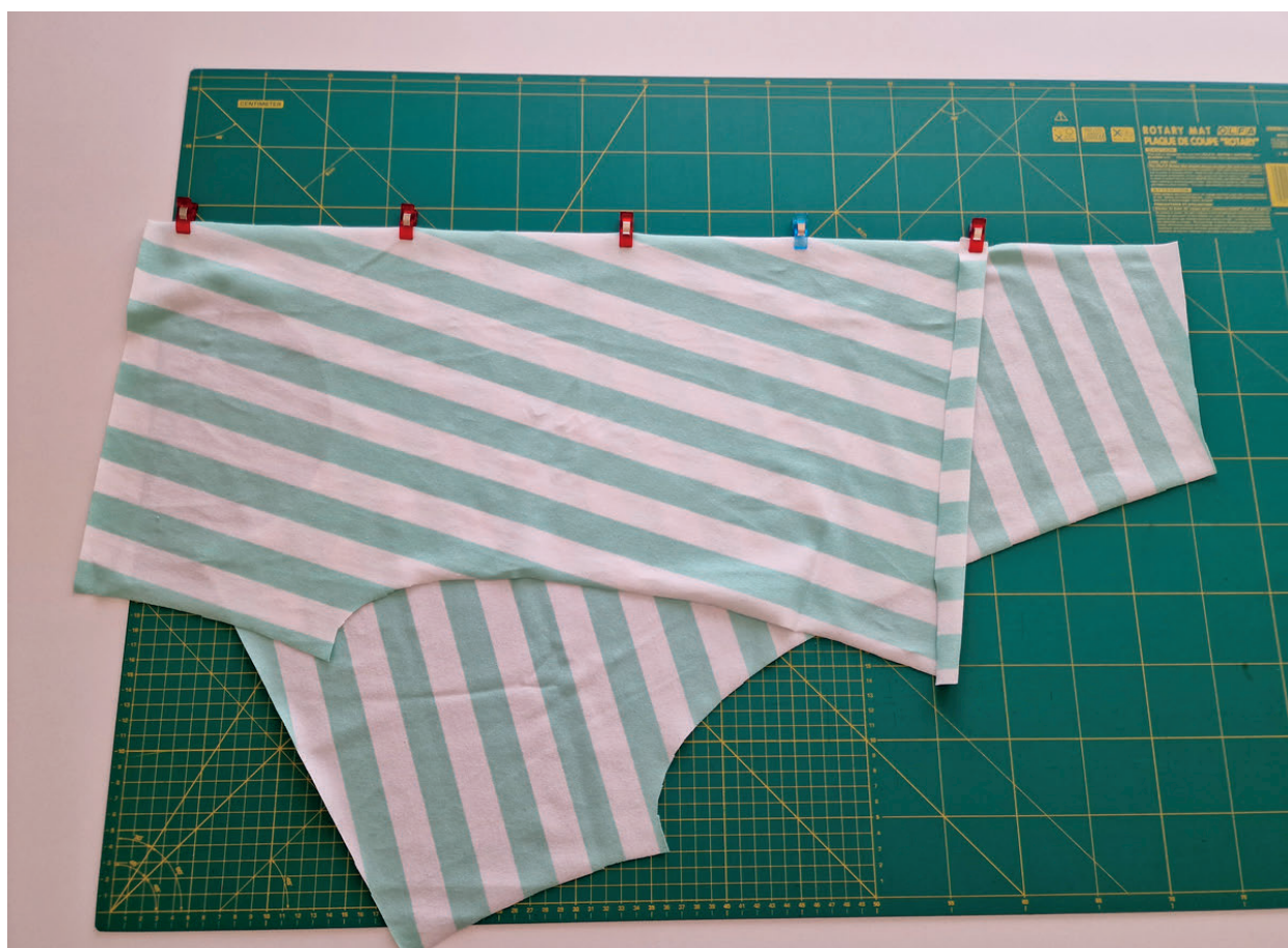
6. Poté položíme levý přední díl na pravý LS na LS a sešpendlíme k sobě. U dolního kraje levého předního dílu podehneme záložku dolního kraje 2cm do RS