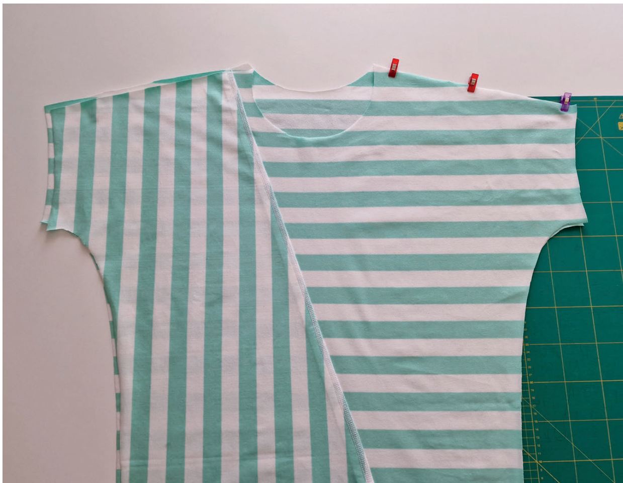
14. Poté sešpendlíme pravou náramenici