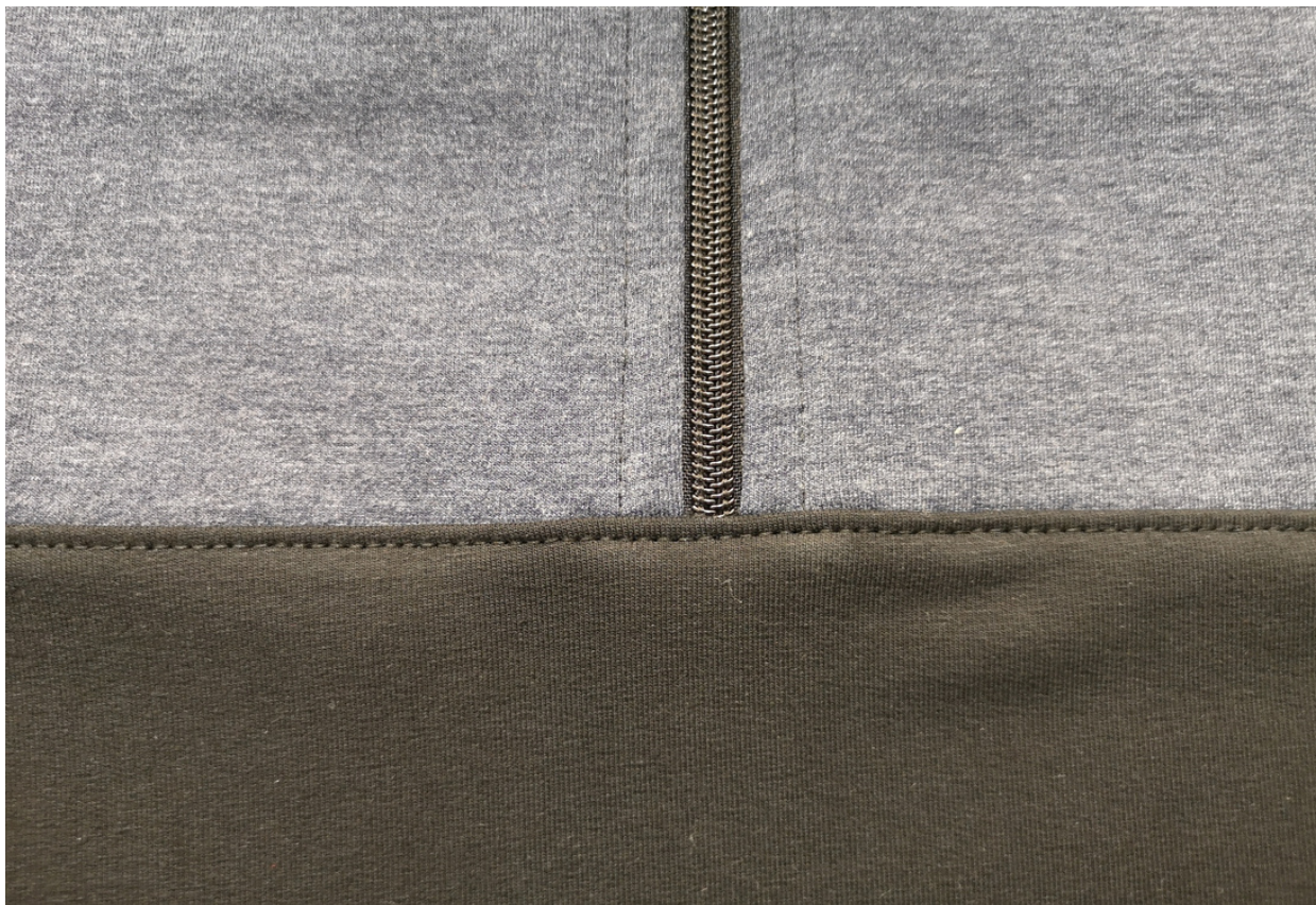
29. Detail prošití