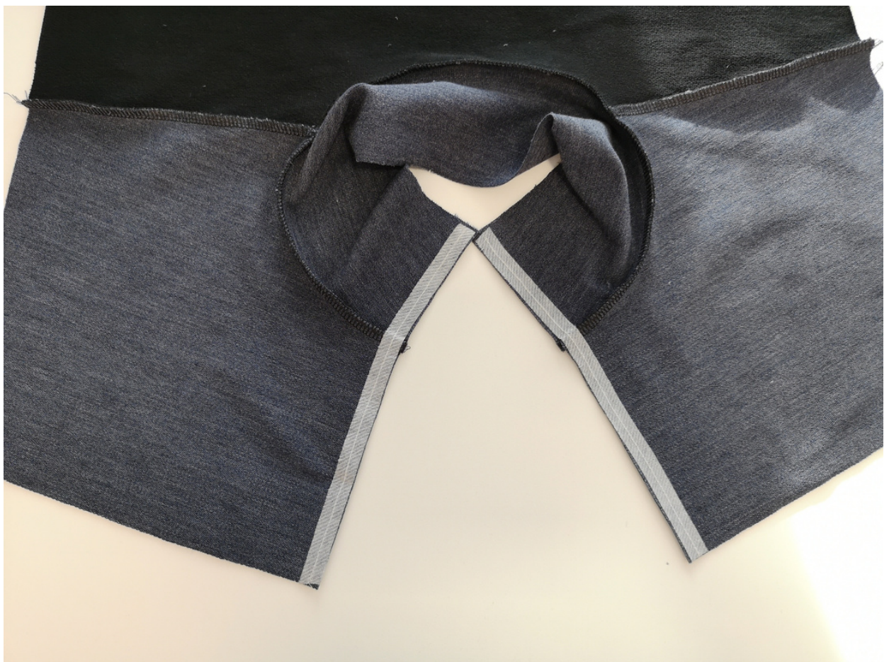
6. Přední kraje mikiny si zpevníme nažehlením vlizelínových proužků.