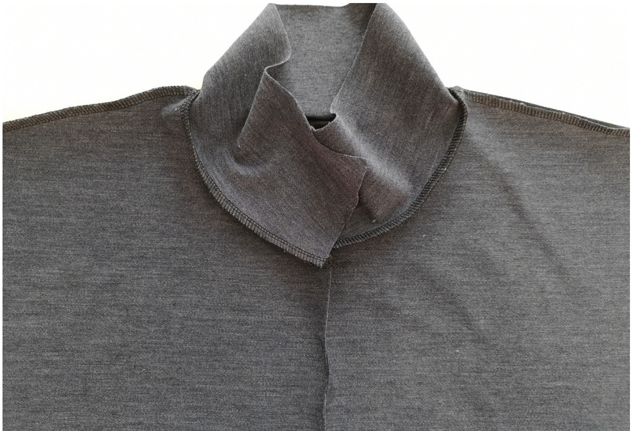
5. Stojáček vsijeme do průkrčníku