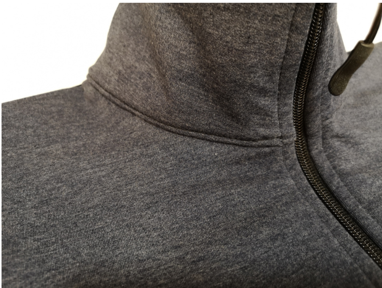
24. Z LS pak v kraji prošijeme