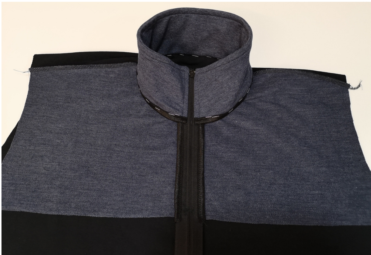
23. Stojáček si nastehujeme k průkrčníku