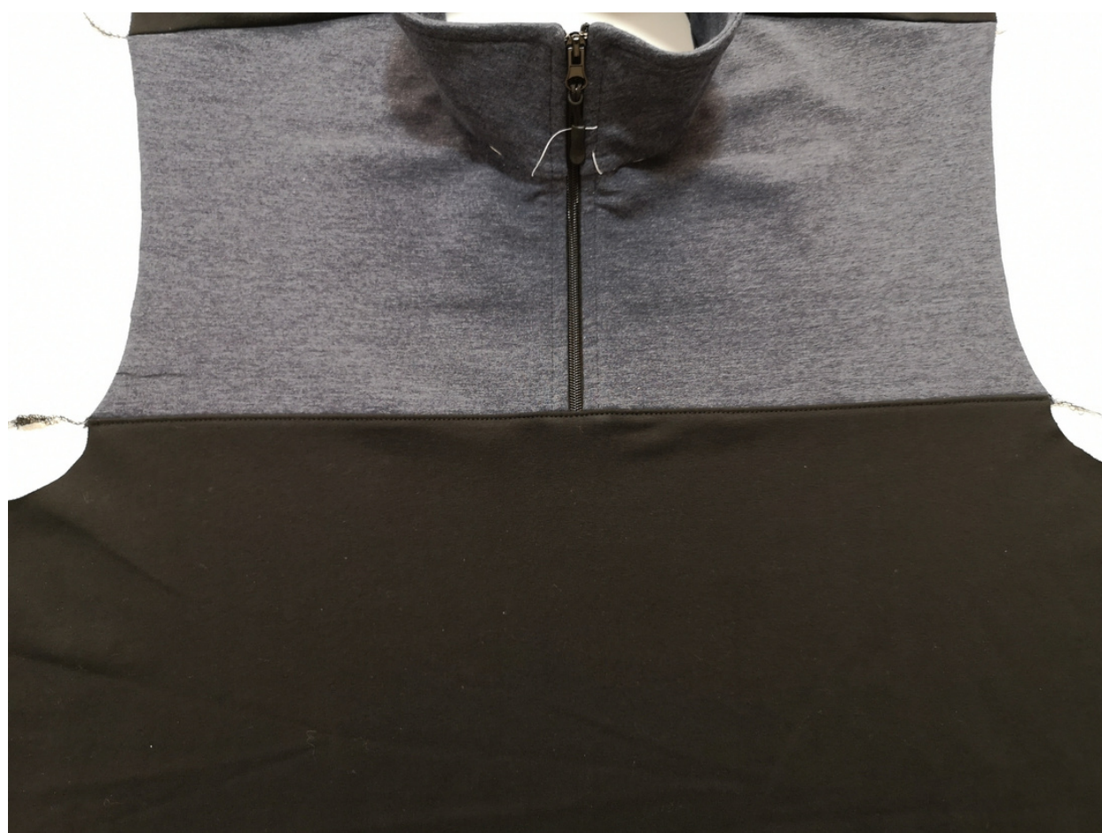
28. Šev sežehlíme směrem dolů a z LS v kraji prošijeme