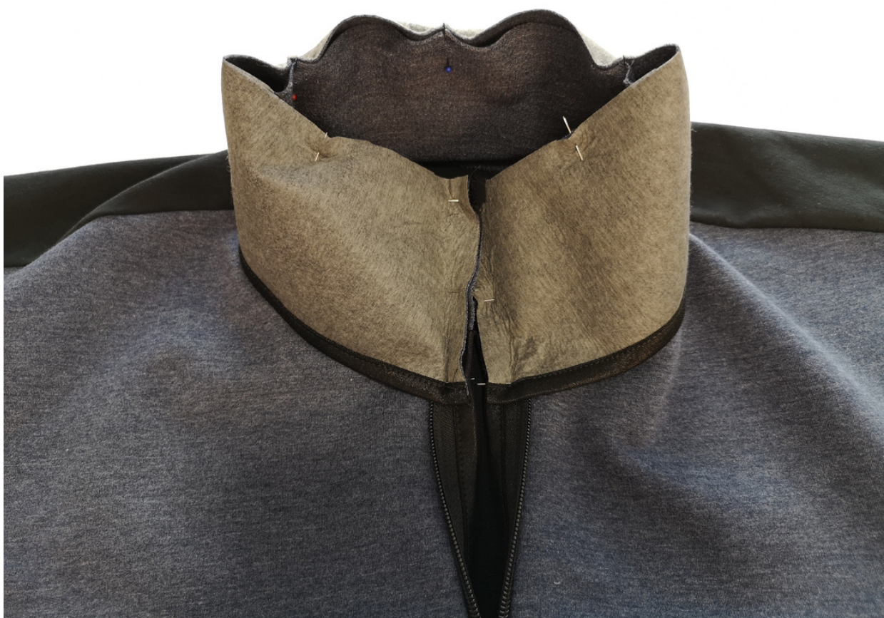
17. Takto připravení díl stojáčku našpenlíme LS k LS našitého stojáčku