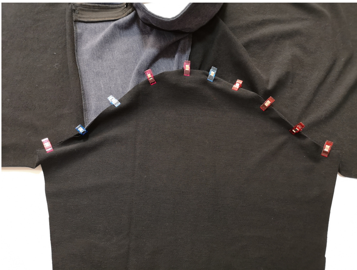
30. Do trupové části našpendlíme rukávy