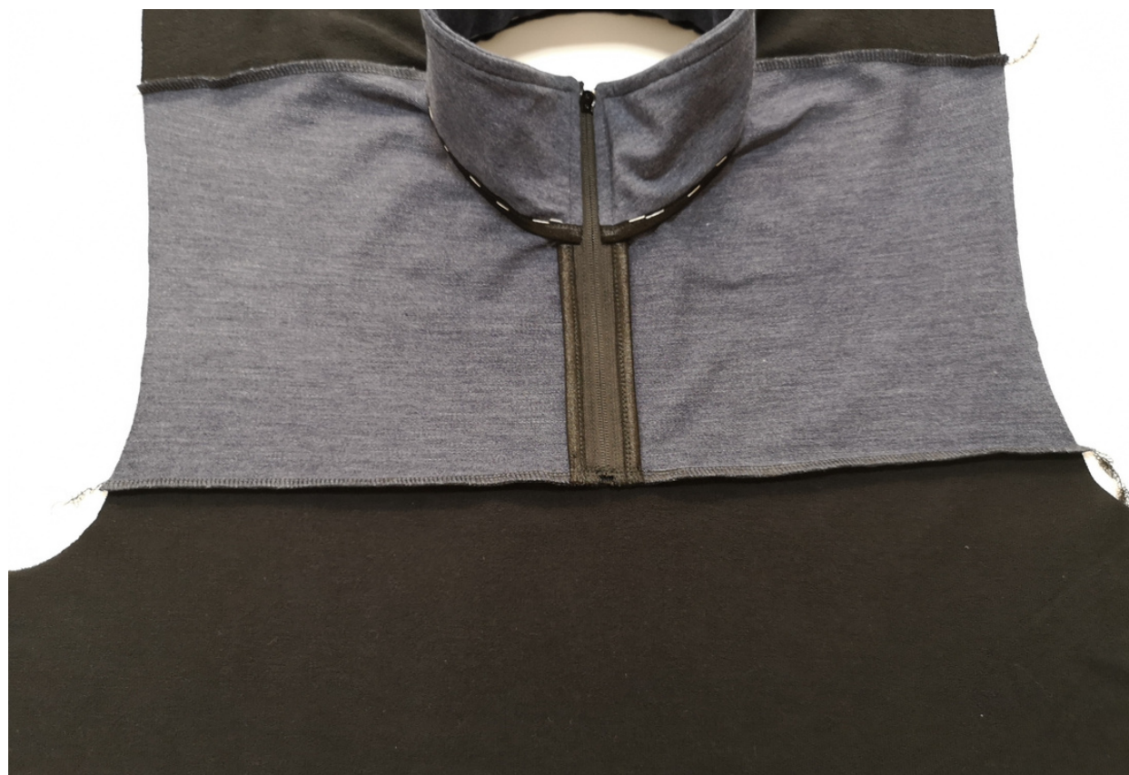
27. Sešijeme sesazovací šev