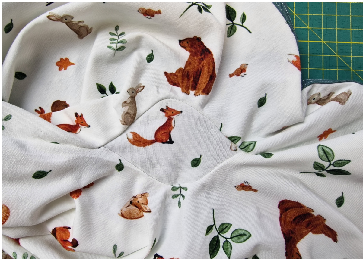
17. Detail sešití v rozkroku.