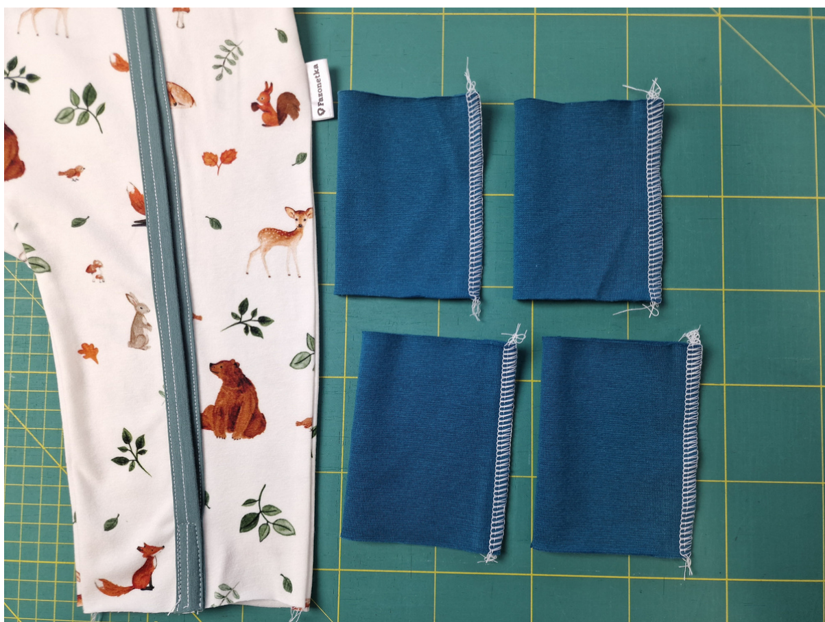
18. Připravené náplety si přehneme na polovinu a sešijeme.