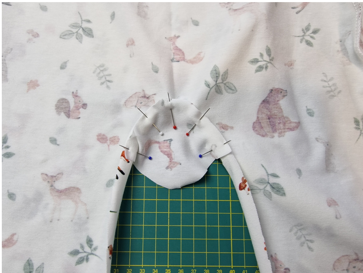
13. Detail našpendlení