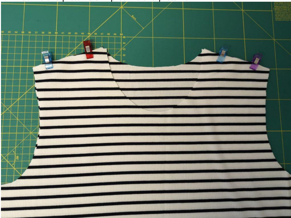
3. PD položíme LS na LS ZD a sešpendlíme náramenice.