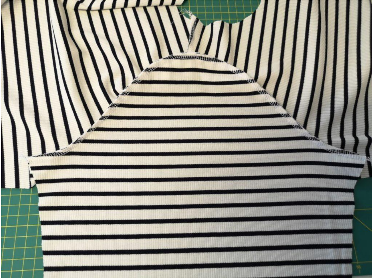
6. A našijeme je