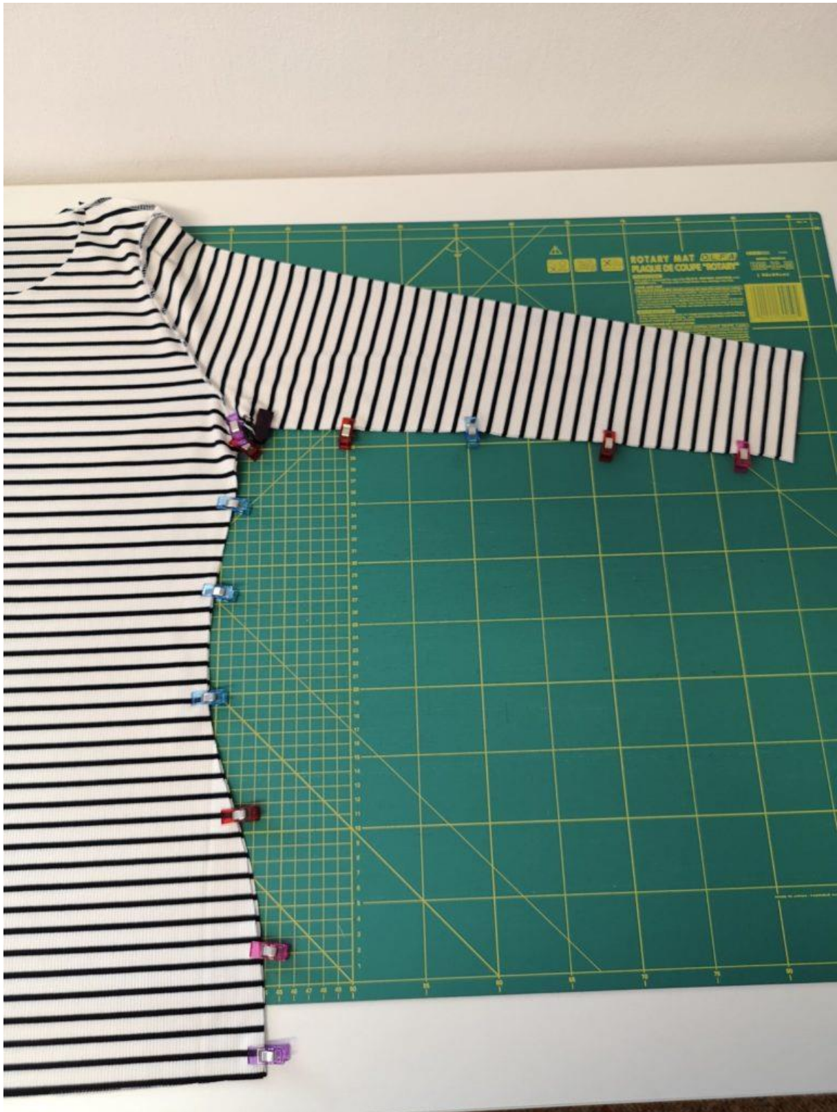
7. Sešpendlíme boční švy roláku a v návaznosti i rukávové švy.