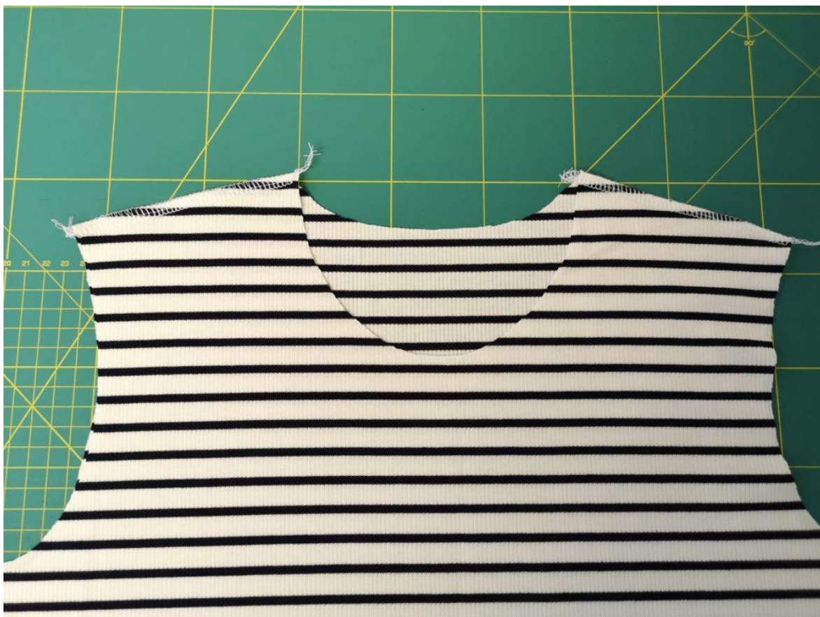
4. Nářamenice sešijeme