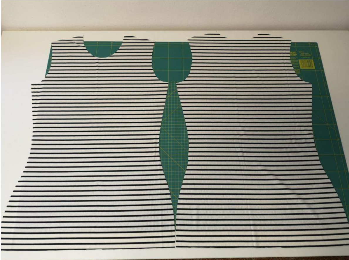
2. 1x Zadní díl na přeložku a 1x přední díl na přeložku