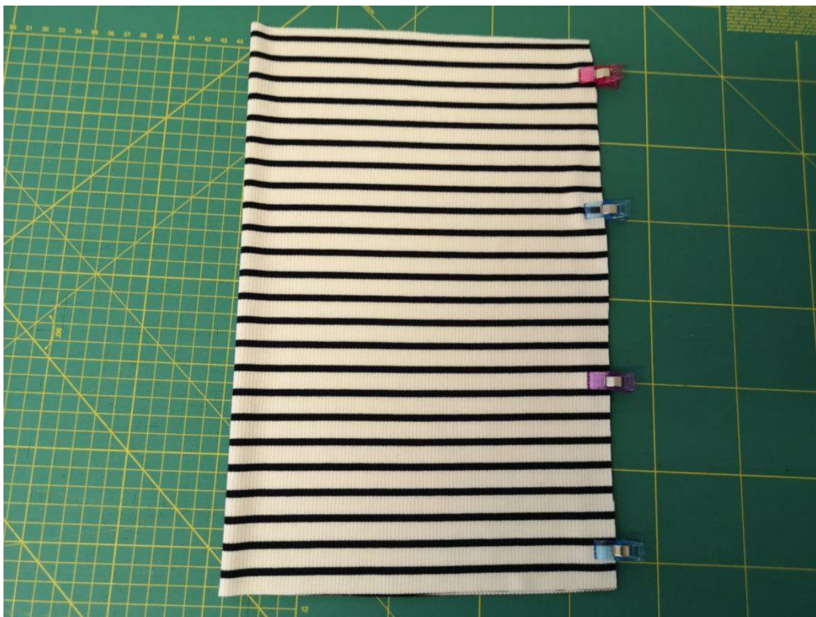
9. Díl roláku přehneme na polovinu a sešpendlíme