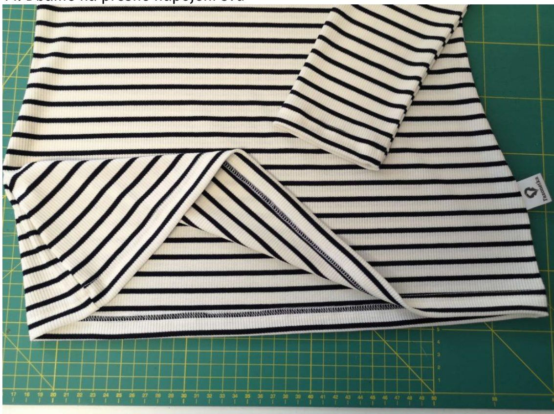
15. Poté už zbývá založit dolní kraj roláku a rukávů 2cm do RS a zažehlit. Z lícní strany prošíjeme záložky na coverlocku nebo dvojehlou, či overlockovým stehem.