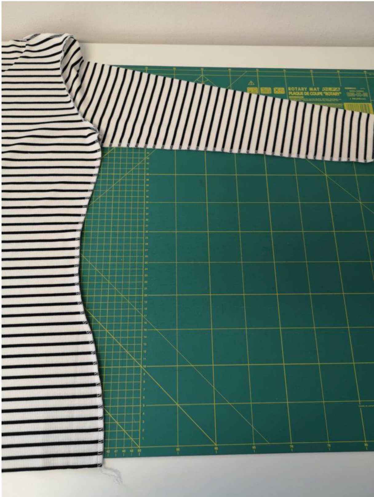
8. Sešijeme boční a rukávové švy