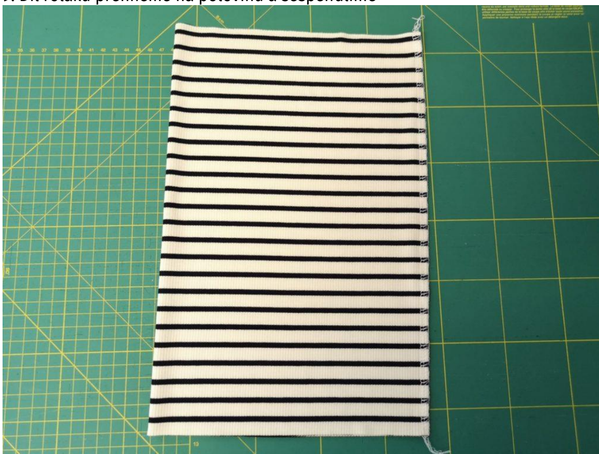
10. Sešijeme rolákový šev